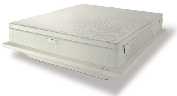
Optic white cod. ow03