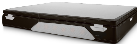
Black/white cod. bw01