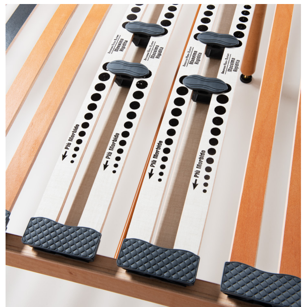
Mini-doghe montate su supporto bilamellare basculante (portanza differenziata per parti del corpo) Mini-slats mounted on a tilting bilamellar support (different firmness for parts of the body)